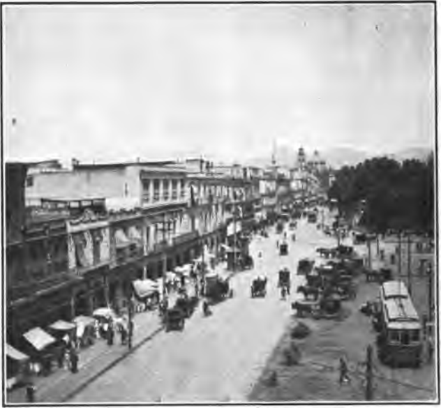
La Catedral y la Plaza

gran cantidad de ganado vacuno, caballos, ovejas y cerdos.